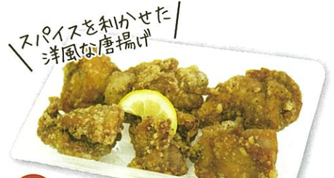
38 自家製鶏唐揚げ (D-Style) 250g 450円