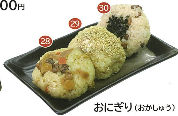
28 五目おこわ 29 醤油お赤飯 30 お赤飯 おにぎり (おかしゅう) 各1個 150円