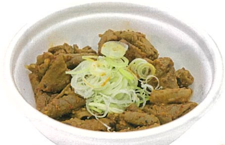
33 もつ焼 (まるぶん) 1パック 600円