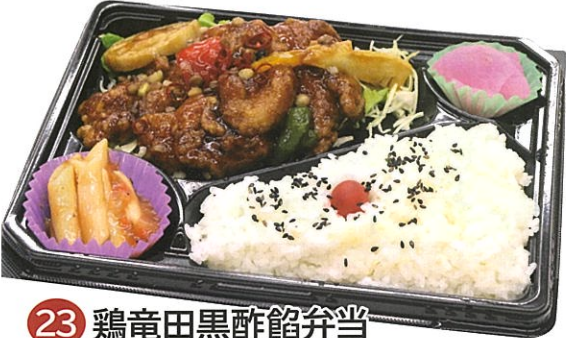
23 鶏竜田黒酢餡弁当 (加工施設部) 1パック 620円