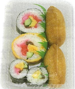
25 すし助六 冷蔵 (石島農園) 1パック 380円 ～