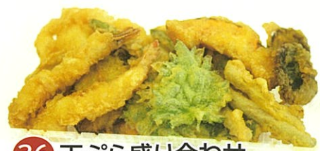
36 天ぷら盛り合わせ (ナンカ食堂) 1パック 580円