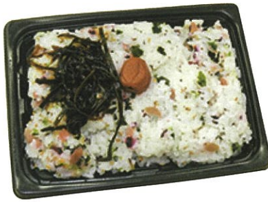
27 さっぱり梅昆布めし (D-Style) 1パック 400円