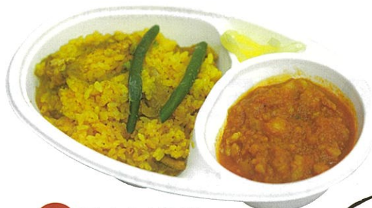
32 チキンビリヤニ (ラング マハール) 1パック 670円