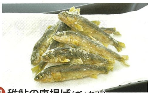
34 稚鮎の唐揚げ (ぎょれん) 1袋(30g) 330円 / 2袋(60g) 600円