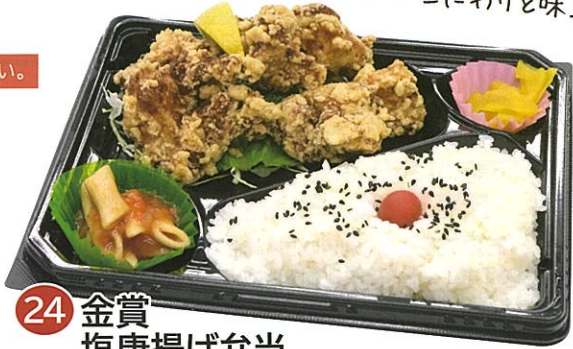
24 金賞 塩唐揚げ弁当 (加工施設部) 1パック 600円