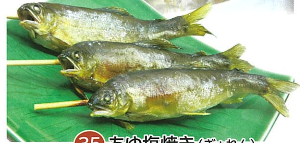
35 あゆ塩焼き (ぎょれん) 1尾 390円 / 3尾 1,000円