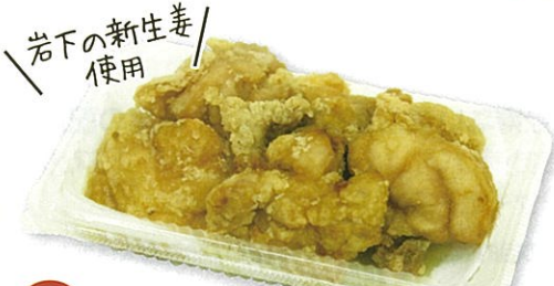
37 “本気”鶏唐揚げ (ナンカ食堂) 200g(5個入) 400円