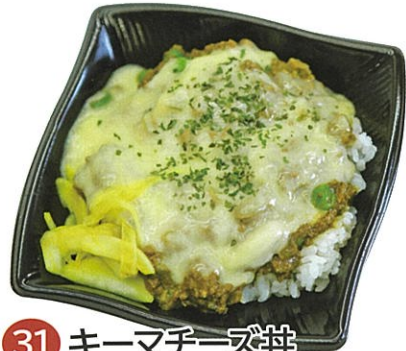
31 キーマチーズ丼 (ラング マハール) 1パック 520円