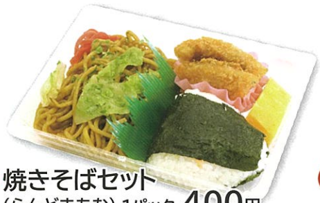
26 焼きそばセット (らんどまあむ) 1パック 400円